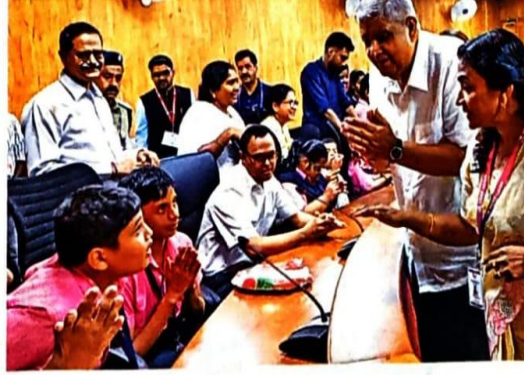
കോട്ടയം നഗരത്തിലെ സി.പി.എം. ഓഫീസിൽ നടന്ന യോഗം. ഇതിൽ പങ്കെടുത്തവർക്ക് കോട്ടയം നഗരത്തിലെ സി.പി.എം. ഓഫീസ് ആയിരിക്കും അടുത്ത ലക്ഷ്യം.