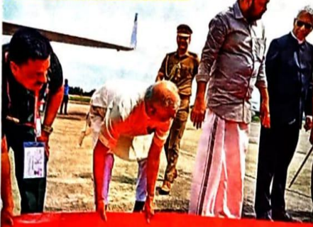
കൊല്ലം നാണിപ്പം കലണ്ടർ കൊല്ലം വിമാനത്താവളത്തിൽനിന്ന് ഹരിദ്വർദ്ദിലേക്ക് യാത്രയ്ക്കായി ഇറങ്ങിയ സി.പി.എം. നേതാക്കളും മറ്റ് പേരും. ഇവരുടെ അടുത്ത ലക്ഷ്യം കോട്ടയം നഗരത്തിലെ സി.പി.എം. ഓഫീസ് ആയിരിക്കും.

'ഗ്രീറ്റ് ആൻഡ് മീറ്റ് ദി വൈസ് പ്രസിഡന്റ്'