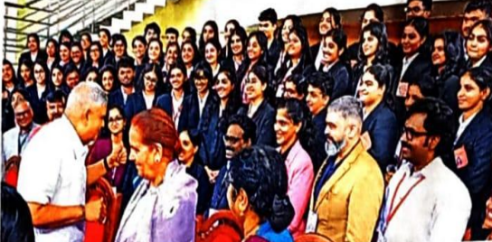
കൊല്ലം നാണിപ്പം കലണ്ടർ കൊല്ലം വിമാനത്താവളത്തിൽനിന്ന് ഹരിദ്വർദ്ദിലേക്ക് യാത്രയ്ക്കായി ഇറങ്ങിയ സി.പി.എം. നേതാക്കളും മറ്റ് പേരും.

കൊല്ലം നാണിപ്പം കലണ്ടർ കൊല്ലം വിമാനത്താവളത്തിൽനിന്ന് ഹരിദ്വർദ്ദിലേക്ക് യാത്രയ്ക്കായി ഇറങ്ങിയ സി.പി.എം. നേതാക്കളും മറ്റ് പേരും. ഇവരുടെ അടുത്ത ലക്ഷ്യം കോട്ടയം നഗരത്തിലെ സി.പി.എം. ഓഫീസ് ആയിരിക്കും.